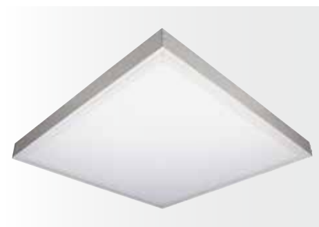
Aufbau-Montagerahmen für LED Panel STEP II, weiß