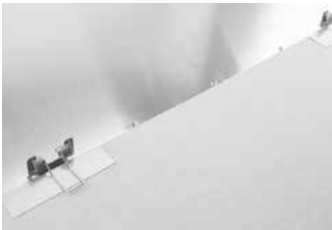
GK-Montage mit SNAP-IN Federeinbausatz