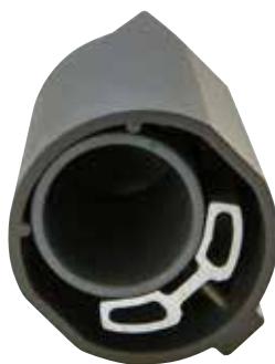
Reduzierstück (18984) für 60 mm Zopfmaß