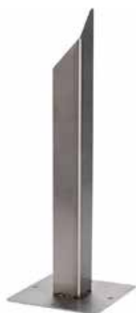
Erdspeiß (Art.-Nr. 18881)