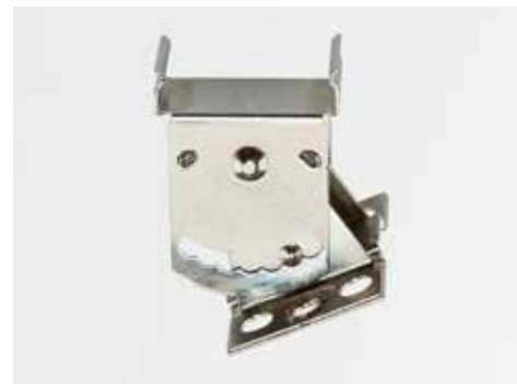
Winkelstück für abgeneigte Montage