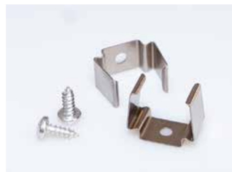
Befestigungsprofil, 2er Set