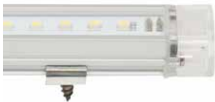
LED Endlostube mit Befestigungsprofil

Andere Lichtfarben oder Längen auf Anfrage.