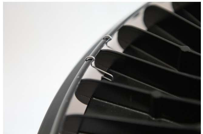
Abb. 5 : Ring von unten unter die erste Klammer schieben