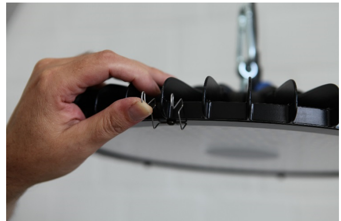
Abb. 2 : Ansetzen der ersten Klammer