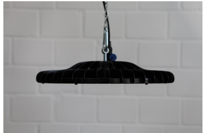
Abb. 1: abalight LED Highbay SUN 135

Entnehmen Sie den Reflektor und die drei Halteklammern der Verpackung und prüfen Sie die Artikel auf Unversehrtheit.