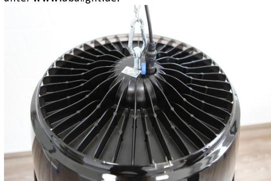
Abb. 8: abalight SUN mit Reflektor CORONA

Technische Änderungen sind vorbehalten. Vergewissern Sie sich, dass Sie immer den neuesten Stand der Informationen verwenden. Aktuelle Informationen finden Sie unter www.abalight.de .