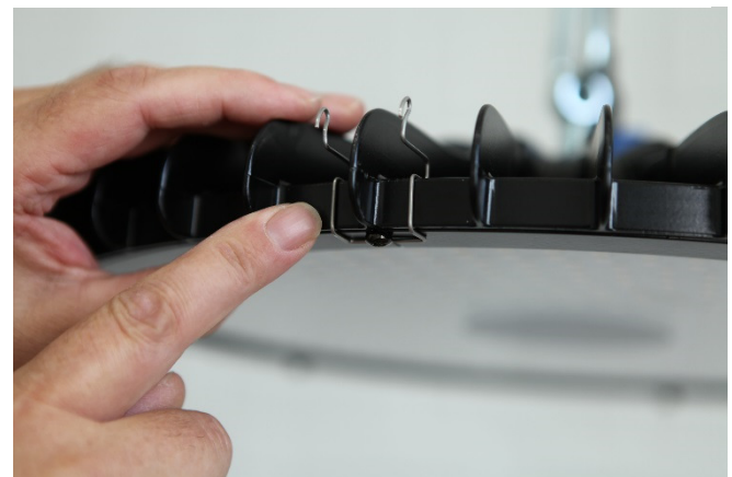
Abb. 3 : Angesetzte erste Klammer