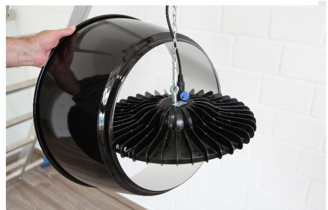
Abb. 4 : Überschwenken des Reflektors