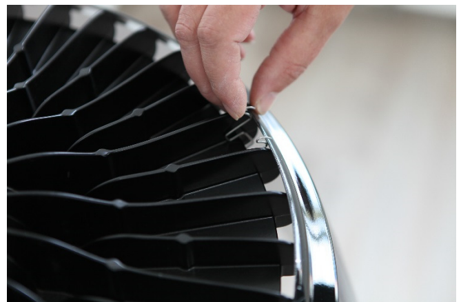
Abb. 6 : Ansetzen der 2. und 3. Klammer