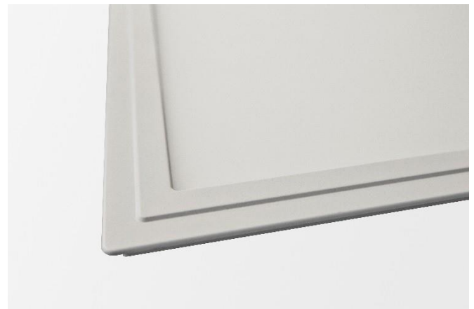
Abb. 2: LED Panel SNAP FIO, Detail Rahmenprofil