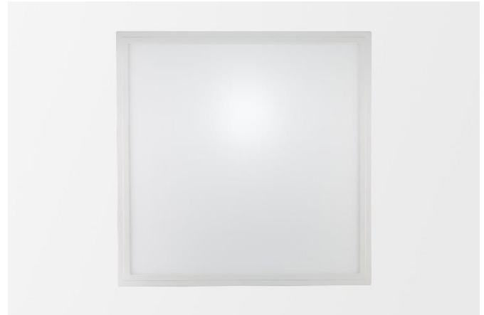
Abb. 1: LED Panel SNAP FIO 618x618 Reinraum

Alle weiteren technischen Merkmale und Daten bezüglich des LED Panels SNAP FIO wie Treiber und Zubehör sind dem jeweiligen Datenblatt zu entnehmen und nach Bauabschluss in der Baudokumentation zusammen mit der jeweiligen Installations- und Betriebsanleitung zu hinterlegen.