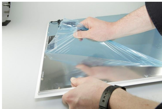
Abb. 6: Entfernen der Schutzfolie

Technische Änderungen sind vorbehalten. Vergewissern Sie sich, dass Sie immer den neuesten Stand der Informationen verwenden. Aktuelle Informationen finden Sie unter www.abalight.de .